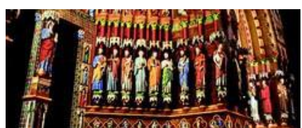
Cathédrale en couleur

La Maison dans laquelle Jules Verne vécut de 1882 à 1900 offre aujourd'hui un espace où se mêlent l'imaginaire et le quotidien du célèbre écrivain. Du jardin d'hiver au grenier, vous découvrirez l'atmosphère authentique d'un hôtel particulier avec son mobilier du XIXème siècle et revivrez les aventures des héros de Jules Verne. Véritable lieu de