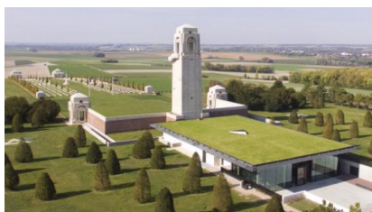
Centre Sir John Monash