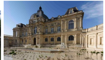
Musée de Picardie

Magistrale, phénoménale ! Les superlatifs ne manquent pas pour qualifier ce monument incontournable du paysage amiénois, bâti en 1220. La Cathédrale d'Amiens est la plus vaste cathédrale gothique de France et fait à elle seule 2 fois le volume de Notre Dame de Paris. Le labyrinthe octogonal formé par son pavement est une invitation à la découverte. Savez-vous que la cathédrale abriterait la sainte relique du crâne de Saint Jean-Baptiste qui aurait été dérobée lors du pillage de Constantinople par les croisés en 1204. Le mystère reste entier.