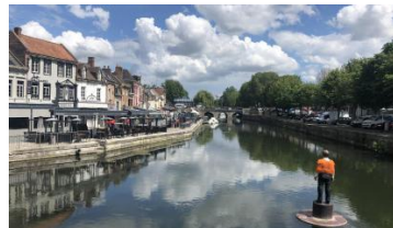
Quartier Saint Leu