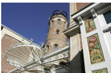
Maison de Jules Verne

Petit-déjeuner à l'hôtel et départ pour une visite libre de la Maison de Jules Verne