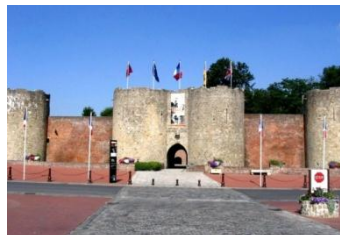
L'Historial de la Grande Guerre